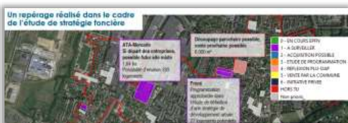
Exemples de cartes support des rencontres individuelles